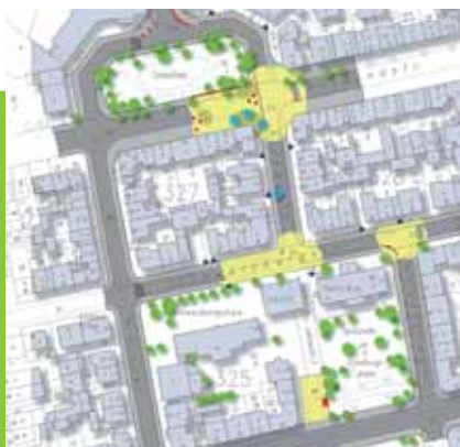
Lenau utca, a találkozóhelyek hálózatának terve

Ezen felül 2008 áprilisától minden lakónak lehetősége van az interneten (Wikimap Nordend) egy virtuális térképre a városnegyed egyes helyeivel kapcsolatos információkat feltenni. Így az ötleteket és véleményeket nyilvánosságra lehet hozni, és ki lehet cserélni. Szervezési megoldásokkal, ideiglenes „játszóutcák” formájában megvalósult találkozó zónák létesítésével siettették a közterek alakítását, amelyeket további kisebb építési beavatkozásokkal, pl. mobil ülőalkalmatosságok (bolidos székek) elhelyezésével segítenek.