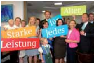
A jelszó a városnegyed - központ avatásán, 2008. májusában

Az önszervező egyesület kiinduló pontja egy azzal az elképzeléssel létrehozott anyaközpont volt, hogy egy ilyen projekthez mindenki hozzá tud tenni valamit a saját képességeiből. A központban 40 tagúra nőtt az egyesület máig is a tagok hivatásbéli és hivatáson kívüli képességeire és készségeire támaszkodik. Így olyan sokszínű kínálat valósul meg, ami mindig az igényeknek megfelelően aktualizálható. Az egyesület hierarchia mentes munkájával számos szinergiahatás jön létre. Az ösztönzés és a megbecsülés kifejezésének érdekében a társadalmi munkát pontrendszerrel értékeli. Az összegyűjtött pontokat a tagok más szolgáltatások ingyenes igénybevételekor válthatják be.