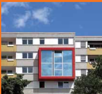
Igazi „blickfang” az új közösségi helyiség

A projekt tekintetében innovációnak számít az építészeti felértékelése, a professzionális irányítás és tanácsadás, csakúgy, mint a városrész lakóinak az önkéntes tevékenységre és a szomszédsági segítségnyújtásra aktiválása. A városnegyedben még számos többgenerációs családi hálózat létezik. A LUWOGÉ által kezdeményezett modelkísérlet célja ezért az, hogy a Pünkösdi réten minden korcsoport találjon lakáslehetőséget. Így a LUWOGÉ hosszútávú lakásbérletet talál, akik a hozzátartozóik közvetlen környezetében lakhatnak.