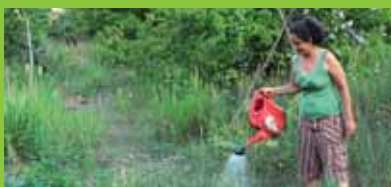
Kertészeti projekt: A Fukuoka-módszer bemutató területe