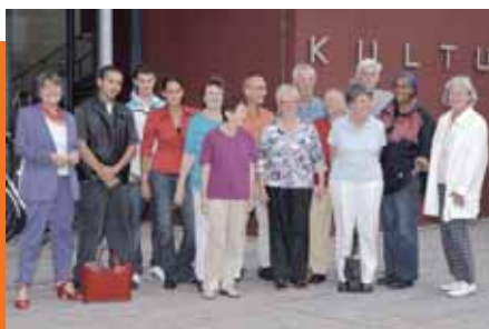
A potencións jövöbeli lakók és az egyesület tagjai

Az átépítési projektben különböző szempontokat kapcsolnak össze egymással: az átépítés fenntartható, akadálymentes és energiatakarékos építési móddal valósul meg. Központi cél ugyanakkor a már működő közösségi szolgáltatók összetételalkotása, mint például a „Fürthért Önkéntes Ügynökség” és a „Kultúrhíd” szociális intézmény egyes egységeinek összehozása az épület közös területén. A projekt innovatív potenciálja a lakók kifejezett önszerveződéséből, valamint a környék iránti polgári és interkulturális elkötelezettségéből adódik.