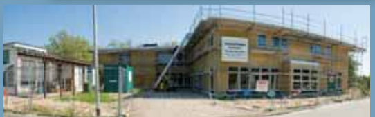
Bővítés és átépítés a többgenerációs ház megszületéséhez