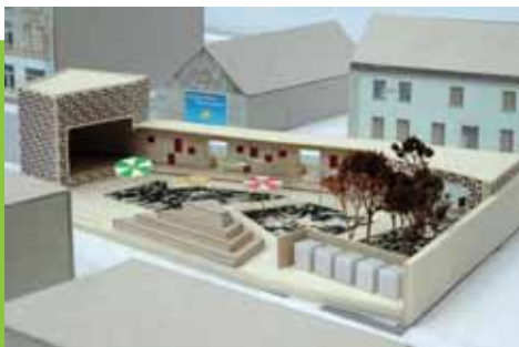
A Könyvjelző modellje