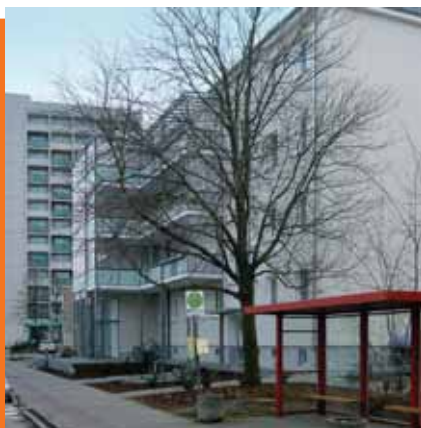
Már elkészült: a fogyatékkal élők lakásainak modula

Már 2007 végén társadalmi összefogással elkészült a mozgáskorlátozott-lakás modul. A létesítmény 24 akadálymentesített lakóegységet tartalmaz, melyekből négyet fogyatékosok számára alakítottak ki. Egy másik részterület a gyerekek és idősek háza. Egy korábbi napközi otthon használatát módosították, így most a szociálisan hátrányos helyzetű családok iskolás korú gyermekeinek nyújt tartózkodási lehetőséget, akiknek segítenek a házi feladatok elkészítésében és szabadidős programokon is részt vehetnek. Egy életvezetési és családsegítő iroda mellett még öt idősek számára megfelelő lakás is felépült. Ezekben túlmenően a Harmónia Házával egy találkozóhely létesül. Az elsődleges cél itt az, hogy az idősebb lakók számára aktivitások és rendezvények céljára teret biztosítsanak. Ennél a projektnél is figyelembe veszik azonban a generációkat összefogó aspektust. A ház konyhájában az idősek a gyerekekkel közösen főzhetnek a spreewaldi tradíciók szerint.