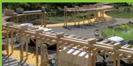
Az Oszlopsor építésével fontos mérföldkővet értek el