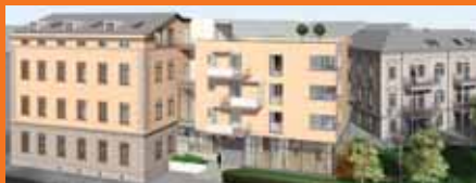
Az egykori kórházból attraktív lakóépület lesz