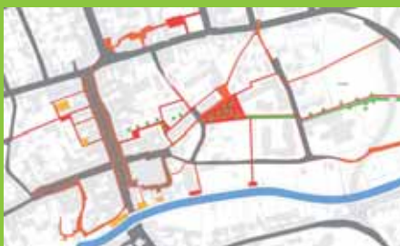
Az úthálózat egységes és akadálymentes megvalósítása megkönnyíti a fiatalok és idősebbek hétköznapi útjait

Ennek a participatív folyamatnak az eredményei a hagyományos tervezési megközelítés negatív tapasztalataiból származnak. Az új lakónegyed-központ nem kötelező érvényű rendezési terveken vagy várostervezési koncepciókon alapul, hanem az elkötelezett polgárok tevékenysége fokozatos fejlődésének önmagát erősítő folyamatán. Létrejön egy olyan tér, amelyet fiatal és idős közös közterületének fogad el.