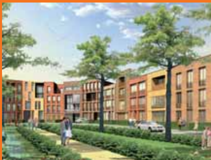
A központi tér kialakításának látképe

Ennek a modellkísérletnek a különlegessége a város szokatlan mértékű szerepvállalása. Ahelyett, hogy a felhagyott belterületi ingatlan ingatlanfejlesztőknek adná el, azt maga fejleszti, egy többlépcsős verseny- és moderációs eljárás során. Ezzel magas város-építési és építés-kulturális minőség, valamint a városrész kedvező strukturális keveredése érhető el. Az kezdeményezésnek sikere van: a roham az építőcsoportok számára kiírt telkekre olyan nagy volt, hogy azokat közjegyzői felügyelettel kellett kisorsolni. Várólisták vannak, és a város már a koncepció más helyszínén való megismétlését mérlegeli.