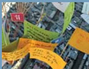
Ötletek a városrészeknek – a játszótéri ünnepség gyűjteménye