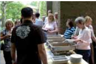
Önkéntes munka a Mahlzeit (Jó Étvágyat) Projektben – a szálloda munkatársai főznek a rászoruló családoknak

Az épületek között a generációk játszótérét hozzák létre. A köztér így a városnegyed olyan hálózati kapcsolatává válik, ahol innovatív az új technológiák használata is. A középpontban a mindennapi életet segítő új technológiák alkalmazása áll. A városnegyedben kialakított telefonhálózaton mindenki a saját anyanyelvén kaphat felvilágosítást. A műszaki médiahasználati képességek (főként az idősebbek számára) és a társadalmi médiahasználati készségek (főleg a fiatalok számára) szükségességét „média-tanácsadás” – a fiatalok segítenek az idősebbeknek és fordítva – segítségével érik el.