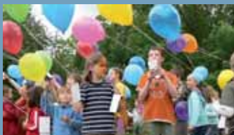
Léggömbök emelkednek a magasba, a jövő jeleként