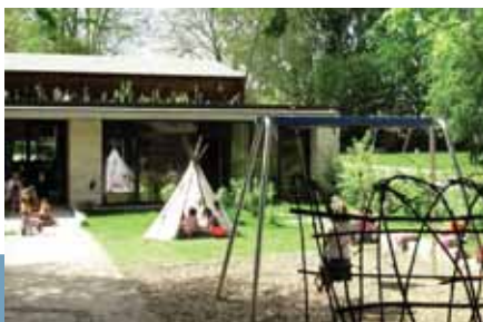
Napköziotthon, mint a koncepció integráló alkotórésze

Az offenburgi modellkísérlet a közösségi intézménynek a városnegyedre gyakorolt sikeres és tartós ösztönző hatását szemlélteti. A fenntartható használatot az innovatív technológiák alkalmazása támogatja, modern épületvezérlés és energiatakarékos fűtési rendszer (geotermikus energia) formájában.