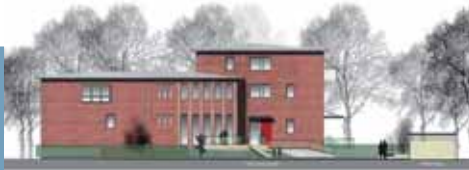
Az „Elba-kastély“ – találkozóhely mindenkinek, egyben helyszín a jó közérzethez