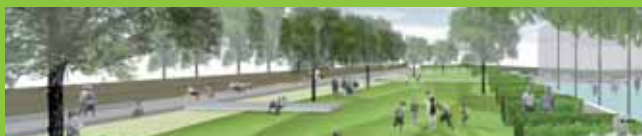
A zöldterület alakításának látványterve