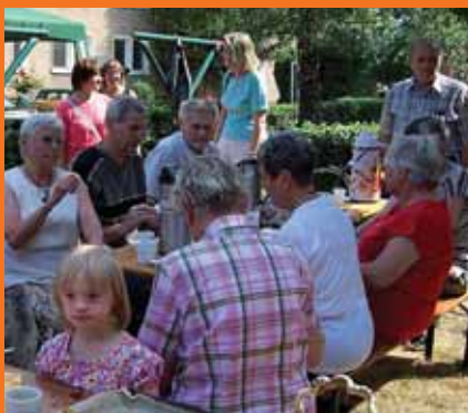
Nyári ünnepség a projekterületen

A projektkezdés óta számos lakótér-tervezési és -kialakítási akciót folytattak le. Az érdeklődőknek szervezett műhelyekről és a közösségi lakóprojektekéről szóló kiállítás (Közösen Tervezni – Együtt Lakni) mellett egy kirándulást is szerveztek Hessenbe, hogy a már megvalósult projektekből gyakorlati tapasztalatokat szerezzenek. A sokféle területre kiterjedő tervezési folyamat azt mutatja, hogy itt nem egyszerűen „kívülről jövő” építési tervek valósulnak meg, hanem a potenciális, jövőbeli lakók aktívan rész vállalnak új otthonuk megtervezésében. A LÉT részéről a közösségi és az egyéni érdekekre egyaránt odafigyelnek. Így az oldalfolyosók eredetileg tervezett átépítését félretették, mert az érdekeltet inkább a balkonokat favorizálták.