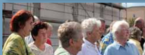
Sonneberg polgárai informálódnak az ügyek állásáról