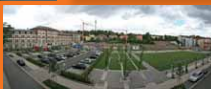
Samuel Beckett Park: itt épül a két lakásprojekt