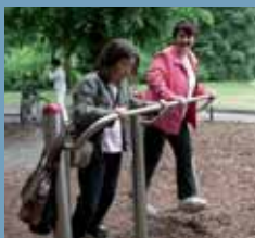
A köztéralkatáshoz egy kiránduláson próbáltak ki játékoszközöket

Az önfelfinanszírozásra és szponzorokra épülő sikeres működési koncepciójával sokrétű kínálat megteremtésére képes. A központban elsősorban családokat támogatnak, így pl. a gyerekeket már 4 hónapos korban felvehetik egy bölcsődebe. A gyerekek felügyelet ideje rugalmas – ennek háttérben azoknak az egyesületi tagoknak a tapasztalata áll, akik maguk is dolgozó anyák.