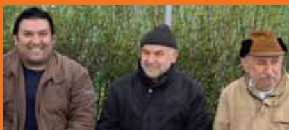
Időszakos otthont keresve