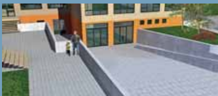
Az átépített iskola bejáratának környezete