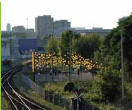
A parkban különféle rendezvények is helyet kapnak, mint pl. a „Behangolt város” fesztivál