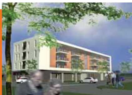
Hűsz akadálymentes lakás épül

A több generáció együttlakása gondos tervezést igényel, elsősorban a családok szempontjából, máskülönbön könnyen összeütközésbe kerülnek a napi életvitellel kapcsolatos különböző érdekek, mint pl. a tevékenység és a nyugalom iránti igények.