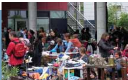
Bolhapiac a Kultúrpasszázsból – egy a sok hasznosítás közül

Az internet virtuális tere további innovatív lehetőségeket tartalmaz. Az újonnan létrehozott intranetes „Ackermannportál” a városrész helyi kommunikációját támogatja. Itt aktuális információk találhatóak az egész városnegyedből, valamint egy olyan online előjegyzési rendszer is működik, aminek a segítségével közvetlenül az otthoni számítógépről lehet bejelentkezni a gazdag kínálat valamelyik programjára.