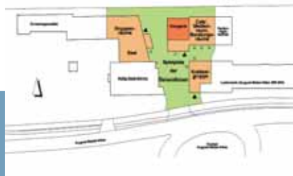
Helyszínrajz: a közterek valósítják meg a térbeli kapcsolatot a negyed épületeivel