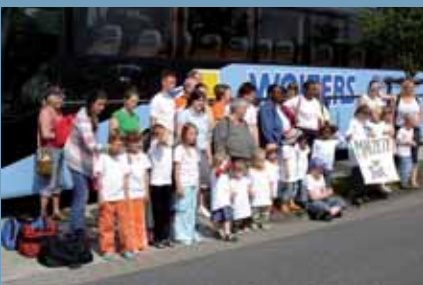
A Mahlzeit Projekttel kirándulnak az északi tengerhez