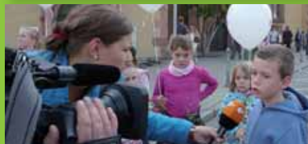
Gyerekríporter a színen