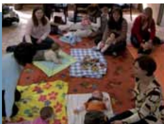
Rugalmas gyermekfelügyelet a bölcsődében

A HELL-GA célja a szomszédsgai közösségi struktúrák erősítése, és emellett a generációkon és kultúrákon átnyúló munkamódszer. Ezzel az egyesület egyre inkább a városrészi identitásának központi csomópontjává válik, pl. amikor a városrészi projektekkel, vagy a városnegyed weboldalával kapcsolatosan a hagyományos egyesületeket is bevonják a munkába.