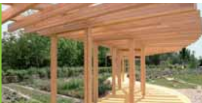
A folyamatos alkotás a közterületnek jellegzetes hangszlyt ad