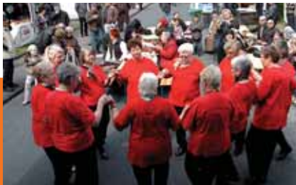
Jó hangulat a közös ünnepen

Sok idős bevándorló évente többször ingázik németországi családtagjai és az egykori hazájában élő rokonok között. Németországban azonban gyerekeik családjainak életformája és lakáslehetőségei is nagyon megváltoztak. Nem akarnak, vagy nem tudnak a szüleikkel tartósan vagy akár ideiglenesen sem együtt lakni. A környéken lévő kis, olcsó lakások, a szükséges kiegészítő szolgáltatásokkal lehetővé teszik az önálló lakást, továbbá a közelség és távolság új egyensúlyát is.