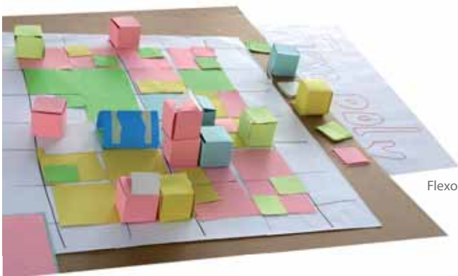
Flexopoly: játék a városnegyed lehetőségeiről

A kísérleti városnegyedeket Schwerinben, Sangerhausenben és Kasselben a diákok és konzulenseik alaposabban górcső alá vették. Szakmai input egészíti ki a helyszíni tapasztalatokat. Befejezésül a diákok egy tervezőműhelyben próbálják az elképzeléseket és a valóságot a konkrét projekttel összekapcsolni. Izgalmas kísérlet és fontos kiegészítése az „Innováció a mindenki számára készülő városnegyedhez” kutatási témának.