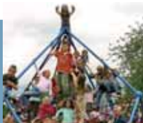
Fiatalok és idősek találkozása és egymásra támaszkodása

Városrész-ünnepek, házszentelők és városrész-újság reklámozza már az építési fázisban a készülő központot. A fiatalok a tervezési játék keretében áttervezik a többgenerációs ház külső tereit. Velük együtt alakítottak ki egy biciklipályát, amivel aktívan bekapcsolódtak a közterületük kialakításába, egyben megtanulták azt is, hogy mások igényeire is tekintettel kell lenniük. Az akció során, az egyes projektelemekre összeállt projektcsoportokba önkéntesek jelentkezhetnek. A társadalmi munka aktiválása és felépítése már a megvalósítás fázisában fontos üg.