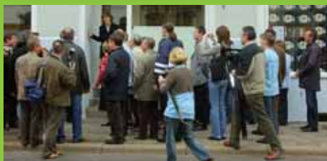
Nagy tömeg a könyvtár megnyitóján