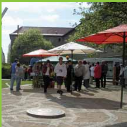
Napóra az akna terv fölött: az idő eljár a bányászat felett

A lakossági elköteleződés gyorsan látható sikere a lakókat a modellkísérleten túlmenően is motiválja a közreműködésre. Az Othaler úti lakossági csoport javaslatokat állított össze a pavilon hasznosítására, és egy közösségi szolgálatot is szervez a városnegyed idősebb tagjai számára.