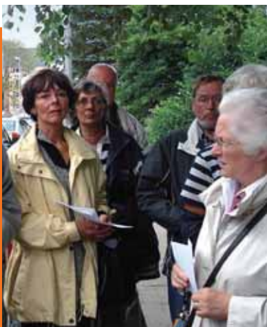
Közös korszátával összekötött beszélgetés az elképzelésekről a városnegyedben

Tanácsadást működtetnek a generációk együttélésének különféle modelljeihez, pl. az idősebbeknek saját házukba fiatal család befogadásához. A kínálatban szerepelnek továbbá olyan alternatív koncepciók, mint az építő- és lakóközösségek, információk az új technológiák alkalmazásához, valamint innovatív finanszírozási modellek is. A tanácsadásban a személyes és az általános kombinációja is működik. Különféle szakembereknek a finanszírozási és az átépítési lehetőségekről szóló rendszeres előadásai szolgálják a lakosság érdeklődésének felkeltését, az egyéni tanácsadás pedig a konkrét átépítési lehetőségek kialakítását.