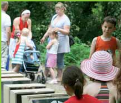
Parknyár: óriásdominó a gyerekeknek