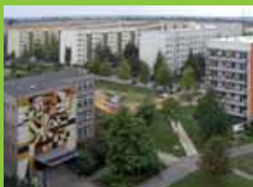
Oszlopsor eleven közteret létesít a lakók gondozzák és használják