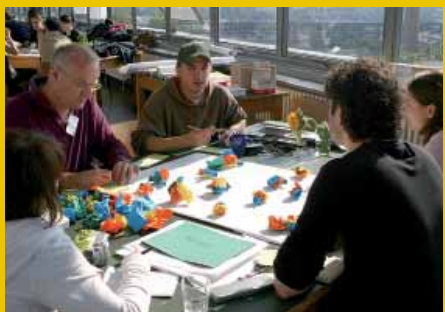
NetworkCity: társadalmi hálózat átalakulóban