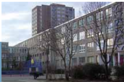
A 25 Iskola üres helyiségeiben jön létre a lakossági kávézó

Egy közeli, nagyjából üresen álló iskolában hosszú távra adnak át helyiségeket lakossági létesítmények és összefüggések céljaira. Igény esetén lehetőség van a hasznosítók körének bővítésére. Az ideiglenes Lakossági kávézó, amely már most a lakossági részvétel és aktivitás megélénkülésének a helyszíne, az átépített iskolában a városnegyed új életének bázisa lesz.