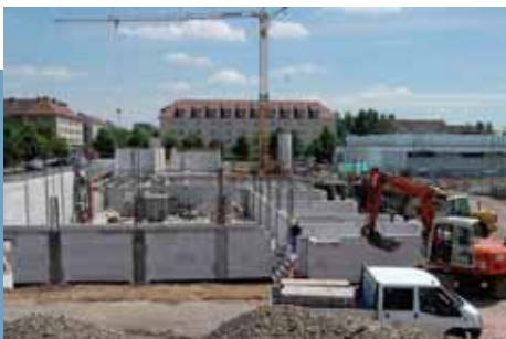
Most hozzák létre az új Multifunkcionális Centrumot

☛ Új technológiák alkalmazása a társadalmi kommunikáció támogatására