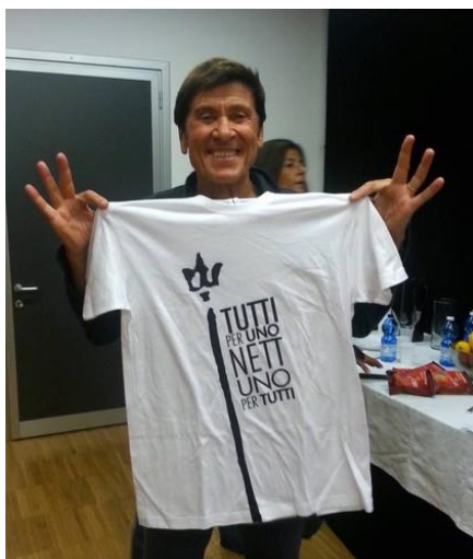
4. ábra: Gianni Morandi a Neptun-póló aláírásakor