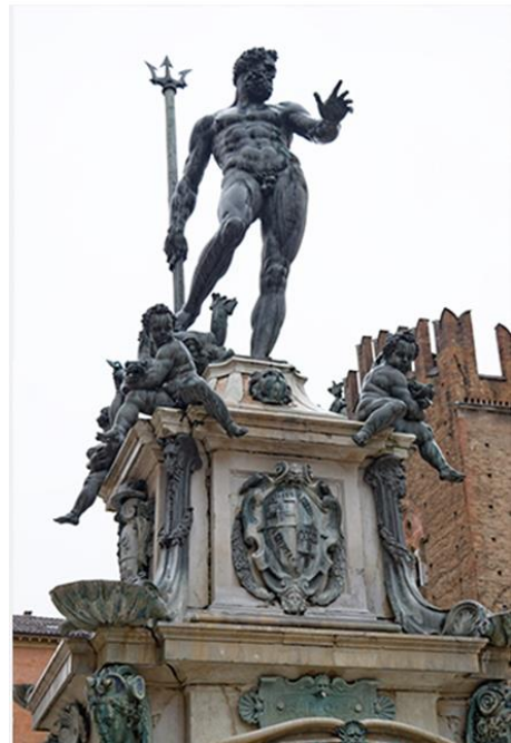
2. ábra: Neptun szobor, 2014