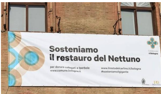
3. ábra: kampány-plakát, forrás: http://www.ilrestodelcarlino.it/bologna/cronaca/nettuno-fontana-restauro-striscione-comune-1.834445