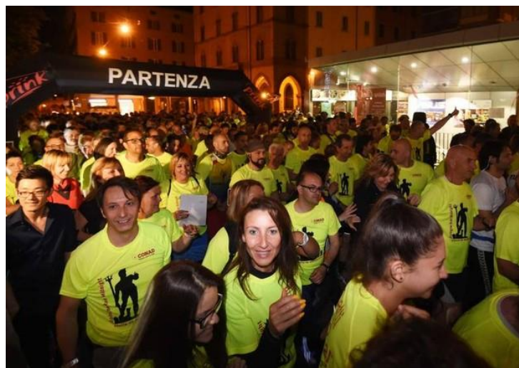
5. ábra: Az egész várost mozgósító esti kampány-futás